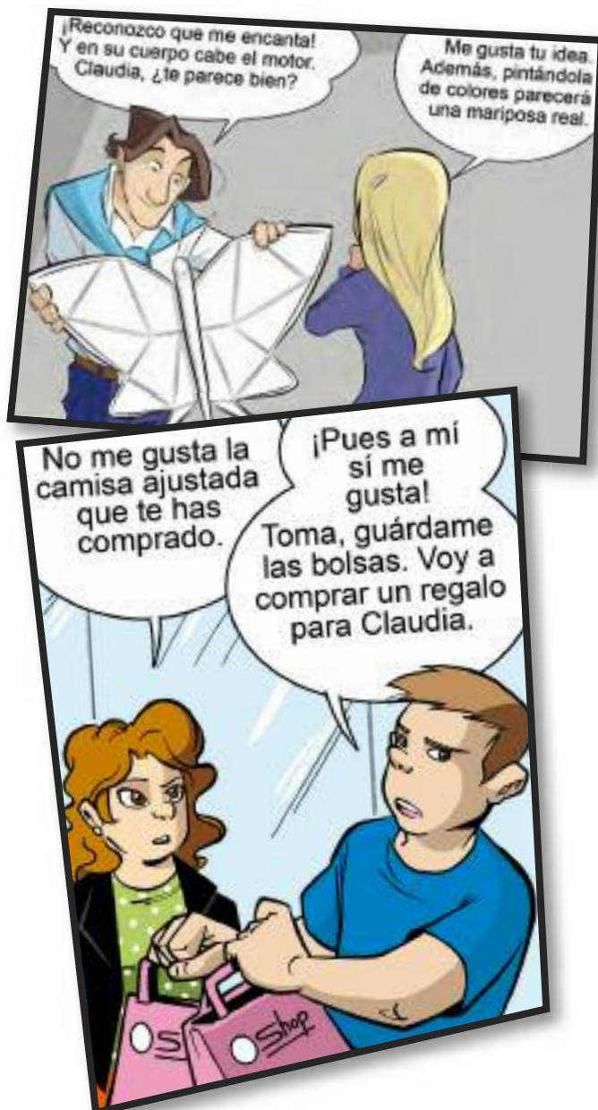
Imágenes extraídas de la colección de cómics "Tengo capacidad, tengo derechos", de DOWN ESPAÑA