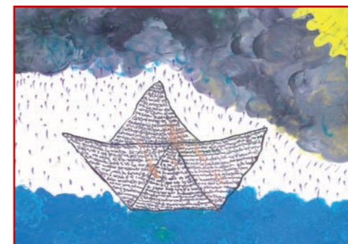
Dibujo ganador 2008 Tema: El viaje de tus sueños Asociación Síndrome de Down de Extremadura (sede en Cáceres)

Si bien FUNDACIÓN MAPFRE ha verificado la planificación del viaje en el que consisten los premios, cabe la posibilidad de que surjan inconvenientes por deficiencias en la organización o en los servicios contratados. FUNDACIÓN MAPFRE queda exonerada de cualquier responsabilidad que pudiera derivarse por estos motivos, así como de cualquier circunstancia imputable a terceros que pueda afectar al correcto disfrute del viaje. Asimismo, tampoco será responsable de los servicios que cualquier otra entidad con la que ésta colabore, preste a los agraciados como consecuencia de los premios entregados ni de cualquier daño, entendido de la manera más amplia posible, que estos pudieran sufrir durante el viaje.