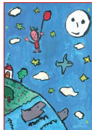
2º Premio 2008 Tema: El viaje de tus sueños APAPNIDICSUR. Asociación de Padres y Protectores de Niños Discapacitados Campiña Sur