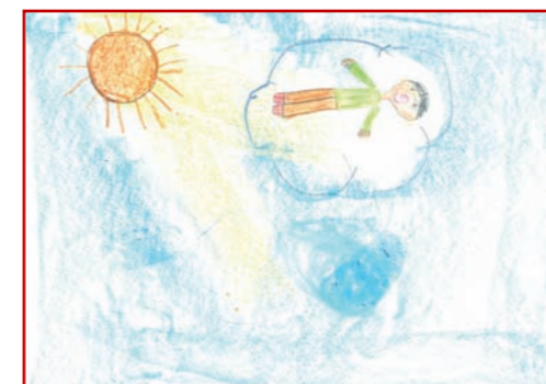
3º Premio 2008 Tema: El viaje de tus sueños ASPACE Granada