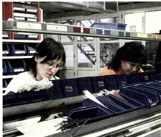
Trabajadoras de la empresa MDI en Mas de las Matas, ayer. J. ZARDOYA

Es uno más de los numerosos casos que en los últimos meses han surgido de empresas relacionadas con la construcción. En Mas de las Matas, desde el último trimestre de 2007, han visto reducidos sus pedi-