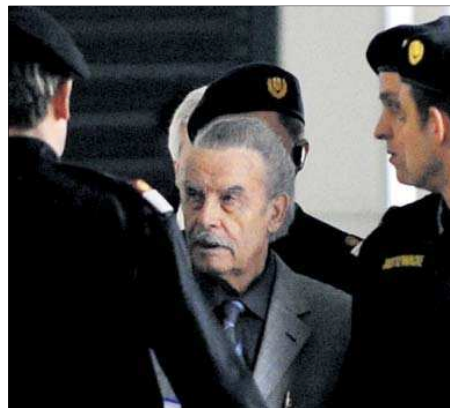
Josef Fritzl, escoltado, a su llegada al juzgado.

Fritzl ocultó ayer de nuevo el rostro y se negó a hablar con la prensa al comienzo de la segunda sesión del juicio, una actitud que, según su abogado, se debe a que «se ha avergonzado».